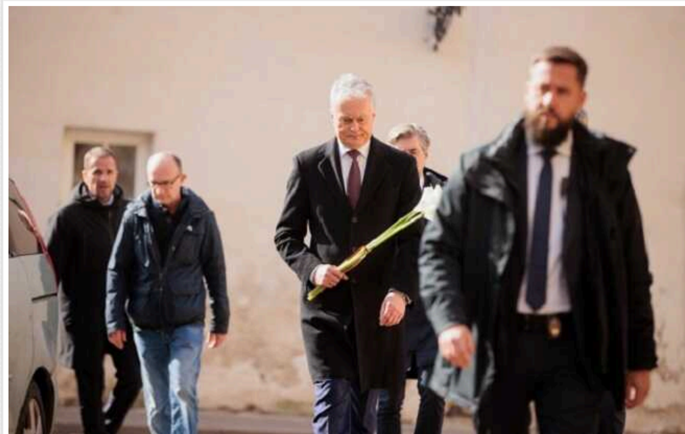
Президент Литви та міністри прийшли на прощання із загиблим в Україні добровольцем

У п'ятницю, 15 березня, президент Литви Гітанас Науседа прийшов на церемонію прощання з литовським добровольцем Тадасом Тумасом, який загинув під Бахмутом, захищаючи Україну.