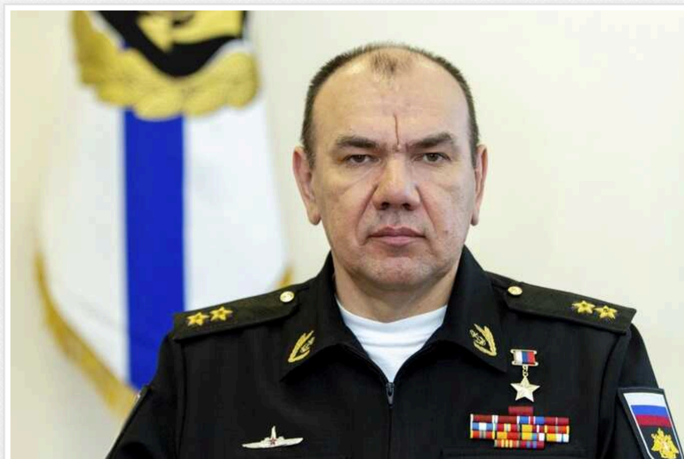
Розвідка Британії оцінила, чим займеться новий очільник флоту РФ

Командувач військово-морським флотом РФ адмірал Микола Євменов після серії значних втрат російських кораблів, імовірно, був відсторонений з посади 10 березня. Його, імовірно, замінить командувач Північного флоту адмірал Олександр Моїсєєв. Першим завданням нового глави ВМФ РФ, очевидно, стане стабілізація ситуації в Чорному морі та підвищення боєздатності Чорноморського флоту.