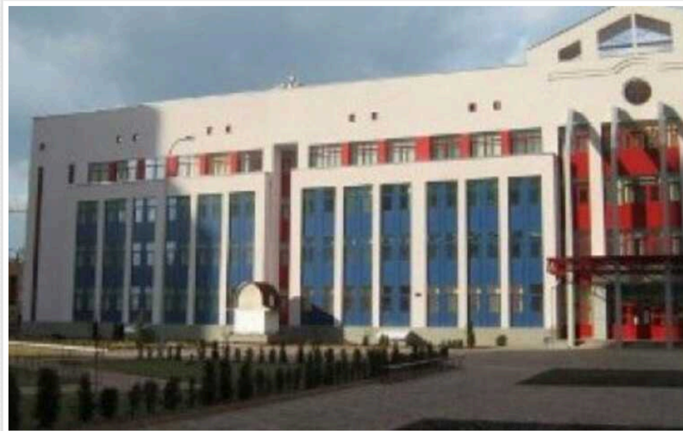
У київській гімназії ім. Гонгадзе проведуть благоустрій за 2 мільйони гривень

Управління освіти Дарницької районної державної адміністрації оголосило тендер. Шукають підрядника, який проведе благоустрій території гімназії за 2 мільйони гривень.