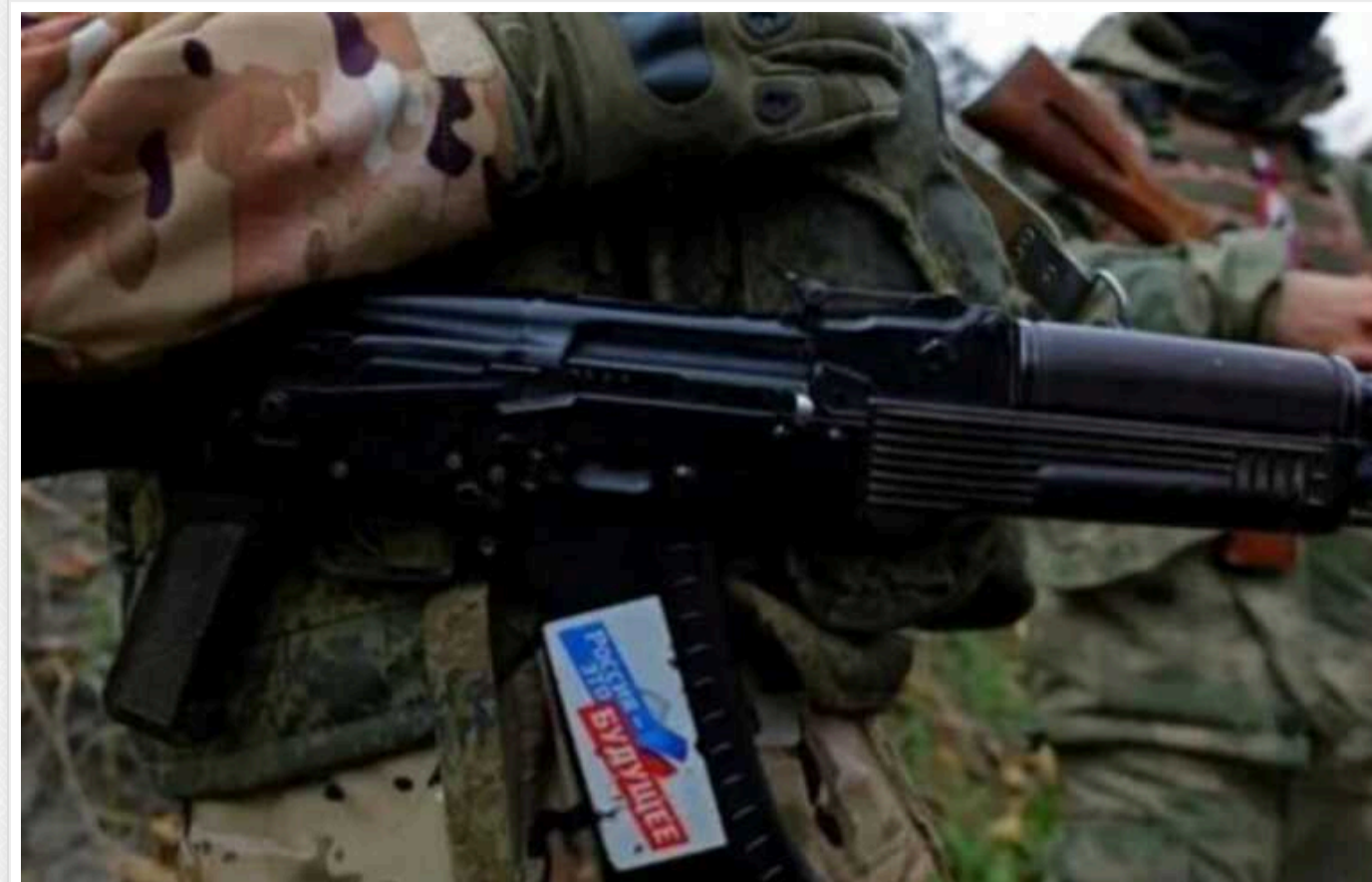
Росіяни в окупованому Генічеську примушують українців до голосування на "виборах Путіна"

У Росії 15 березня розпочалося триденне голосування на фейкових виборах Путіна. Так, в окупованому російськими військами місті Генічеськ на Херсонщині, окупанти силоміць примушують українців голосувати на виборчих дільницях.