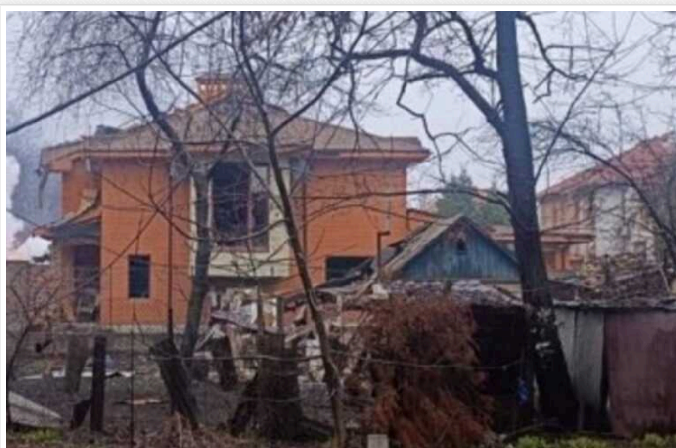
В Одесі через ракетний удар загинуло 8 осіб, - прокуратура

Раніше ОВА повідомляла, що внаслідок ракетного удару пошкоджено цивільну інфраструктуру.