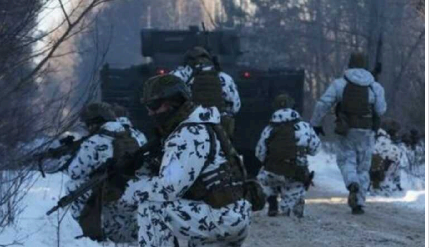
Чому Україна зараз програє у стратегічній адаптації до війни

Ми зможемо перемогти, лише якщо почнемо швидко знаходити та реалізовувати рішення найсерйозніших стратегічних проблем, що постійно виникають у цій війні. Наразі ефективного способу роботи це в нас немає.