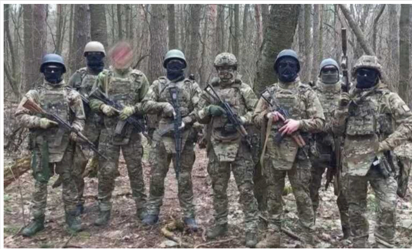
"Можемо констатувати, що Белгородська та Курська області Росії є територією активних бойових дій", - ГУР