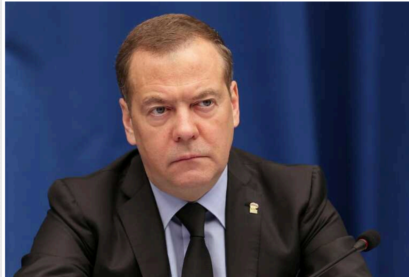
ISW: Медведєв найчіткіше з моменту вторгнення озвучив справжні цілі РФ у війні

"Мир" для Росії означає кінець України як суверенної та незалежної держави у будь-яких кордонах: 14 березня це прямо підтвердив колишній президент РФ Дмитро Медведєв, виклавши т.зв. "російську формулу миру" – жорстоку й безапеляційну.