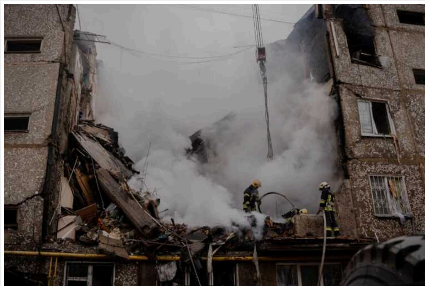
Комісія ООН представила новий звіт про воєнні злочини окупантів в Україні

Незалежна міжнародна комісія ООН з розслідування порушень в Україні задокументувала нові докази того, що російська влада та її війська вчинили воєнні злочини та порушили міжнародне та гуманітарне право на тимчасово окупованих українських територіях.