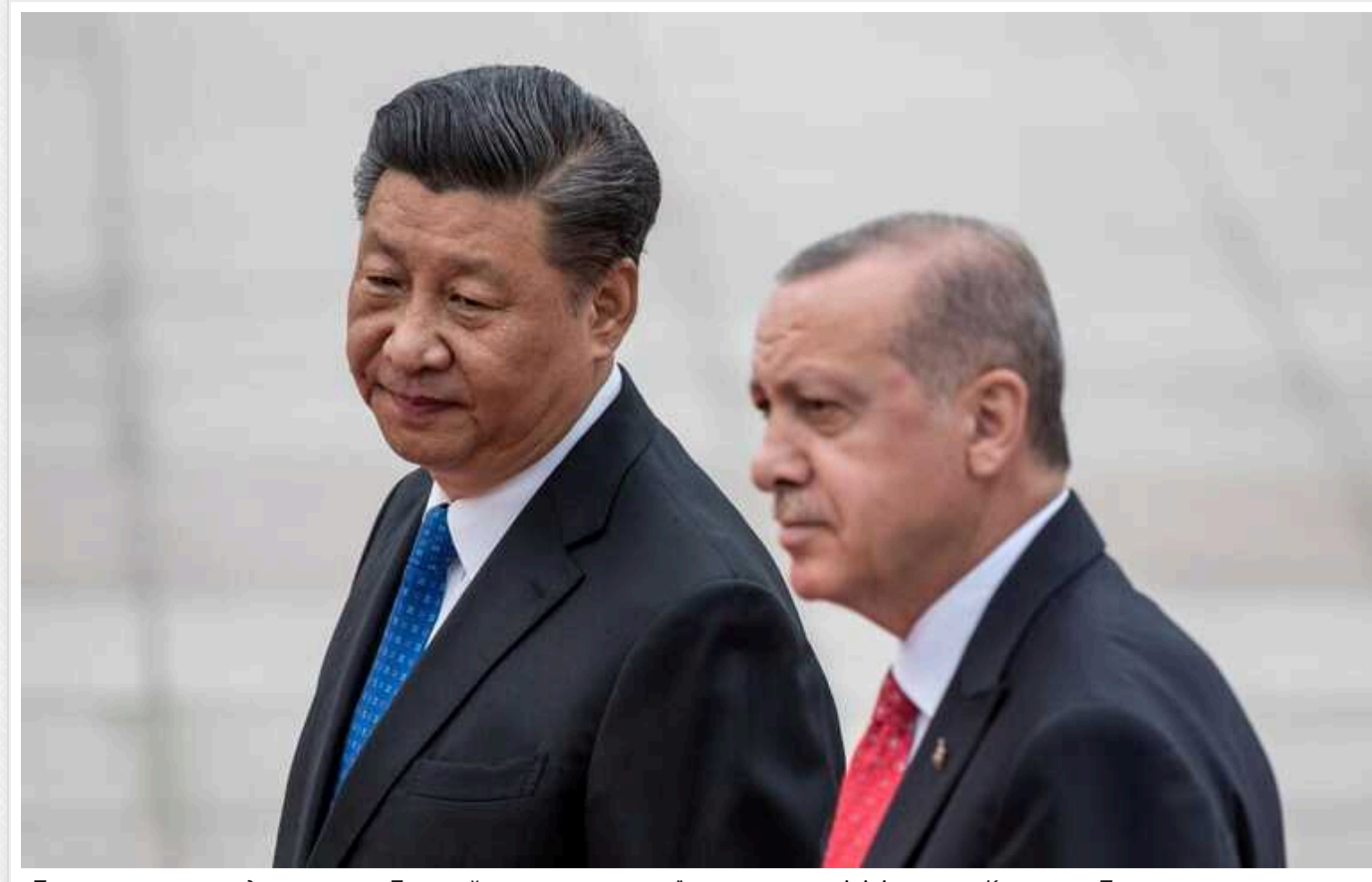
«Турки мають грати дуже тонко»: Пристайко пояснив, що стоїть за мирними ініціативами Китаю та Туреччини

Мирні ініціативи Туреччини щодо війни в Україні пов'язані з її прагненням до лідерства в Чорноморському регіоні, водночас Стамбул обережно формулює умови можливих переговорів. Ініціативи Китаю, своєю чергою, для якого РФ є "зручним" партнером в ООН, "мляві" й дуже формальні.