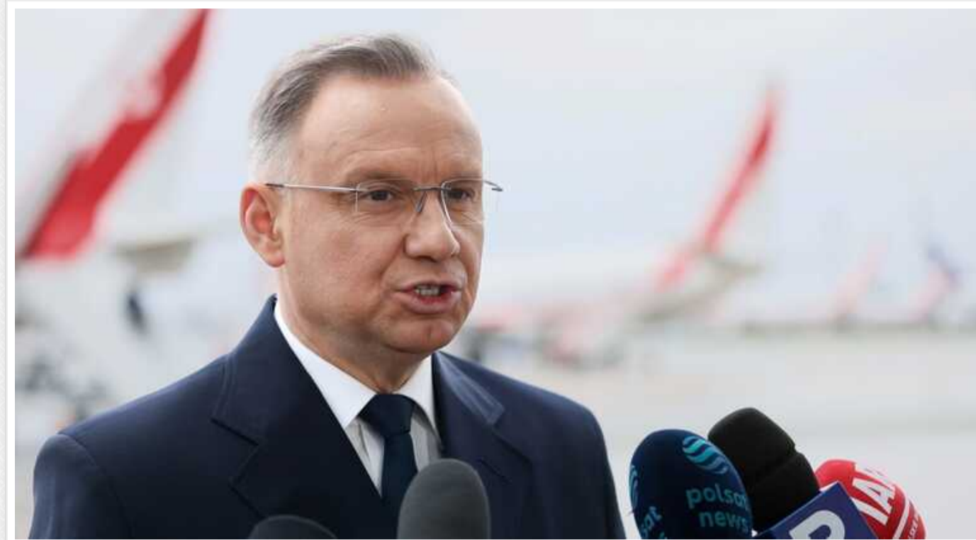
У Польщі сподіваються, що постачання боєприпасів в Україну допоможуть підготуватися до наступу РФ