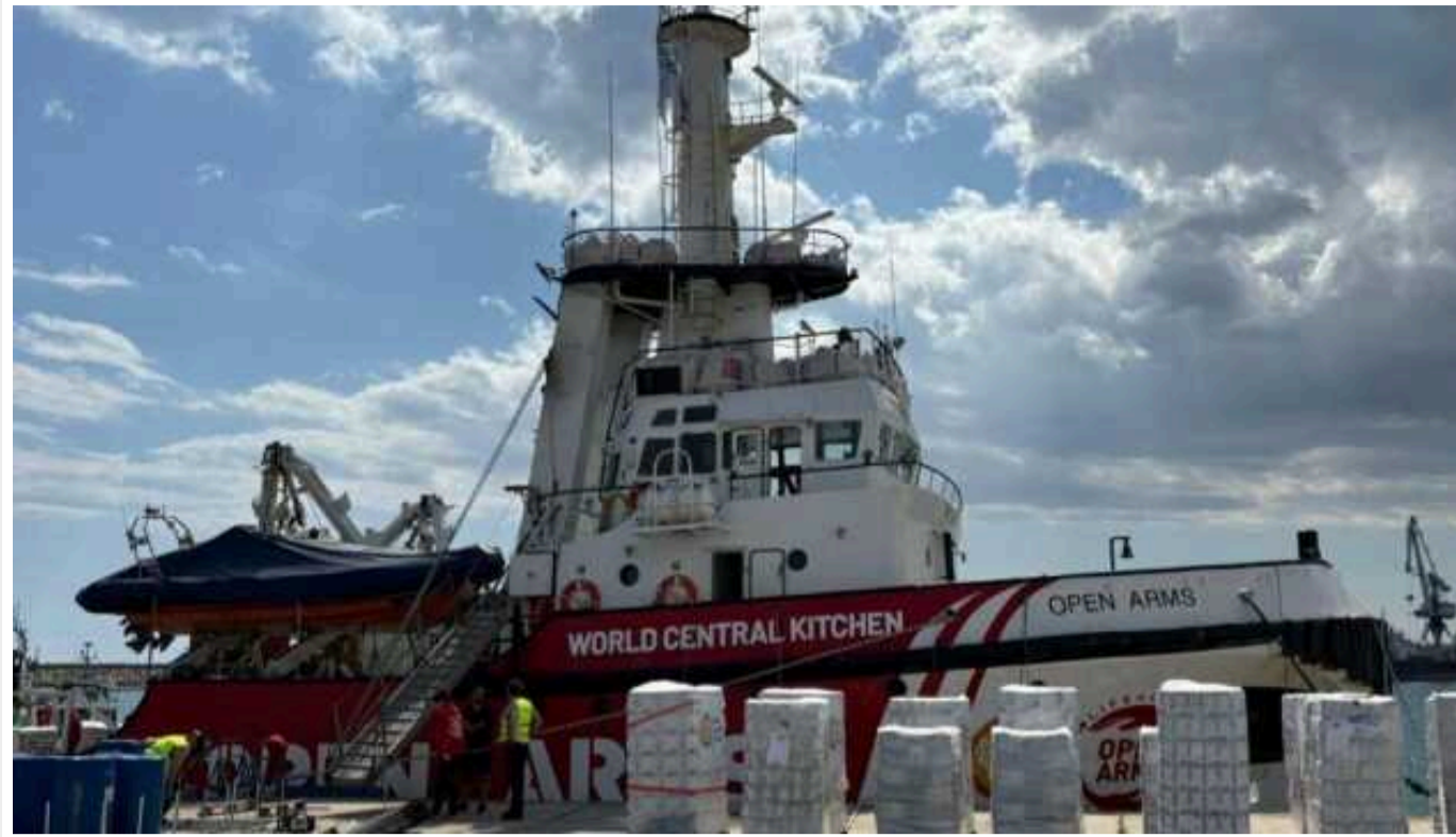
До Сектору Гази прибуло іспанське судно з гуманітарною допомогою

До узбережжя Сектору Гази наблизилася перше судно з партією гуманітарної допомоги, яку направила мешканцям анклаву благодійна організація.