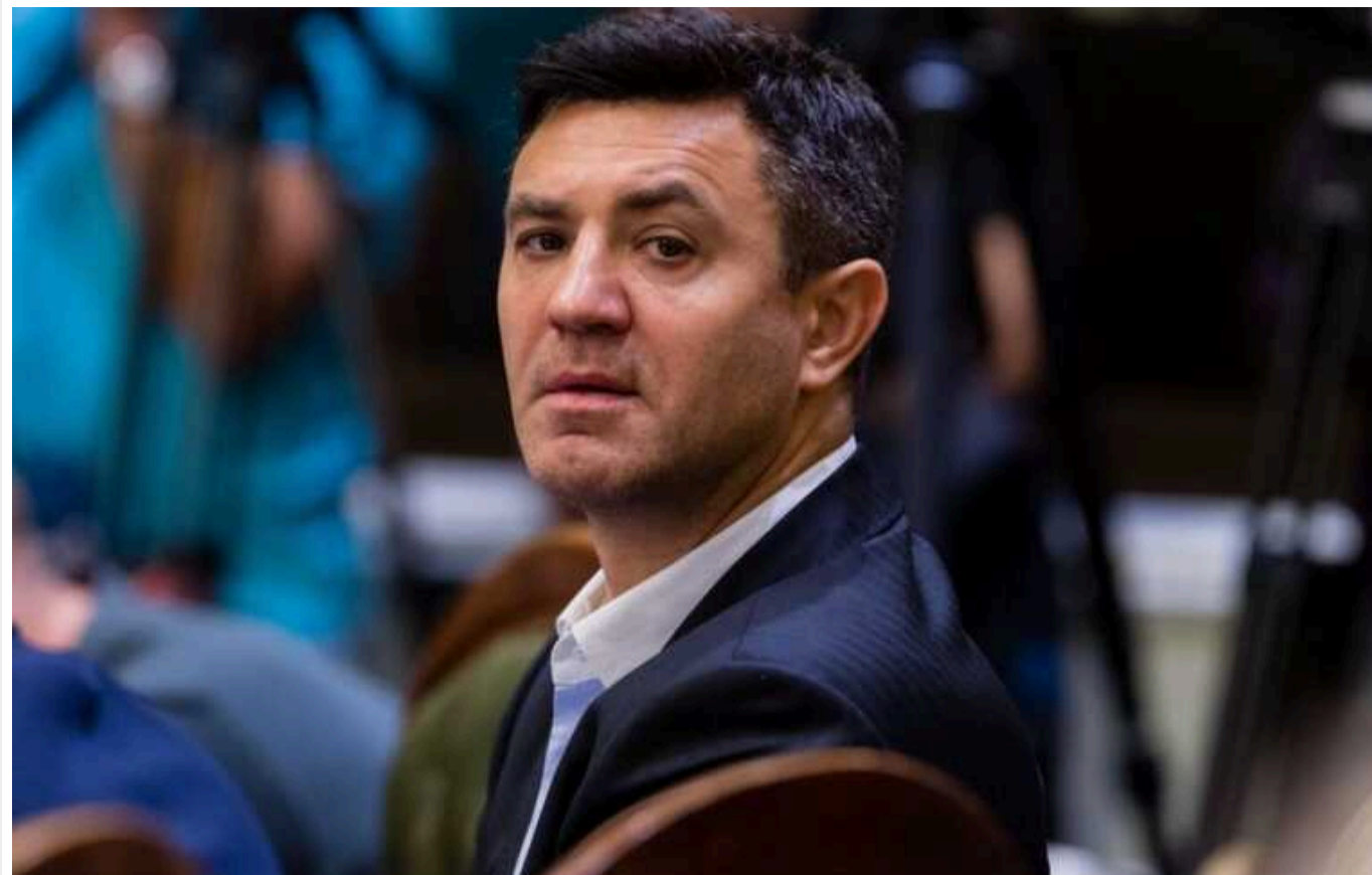
Ужгородська імперія бравого депутата Миколи Тищенка

Апартаменти, салон краси, похоронне бюро, п'ятизірковий парк-готель, два охоронці, свої люди на високих посадах. Це далеко не повний перелік "хазяйства", яким, схоже, обзавівся в Ужгороді народний депутат Микола Тищенко та його родина за останні роки.