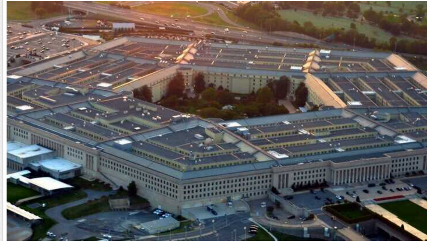
Пентагон поповнить запаси зброї на понад 6 мільярдів доларів, – Bloomberg

Міністерство оборони США планує пріоритетно поповнити свої запаси зброї на 6,5 млрд доларів після надання допомоги Україні. Йдеться про ракети для реактивних систем HIMARS, протитанкові комплекси TOW і прилади нічного бачення.