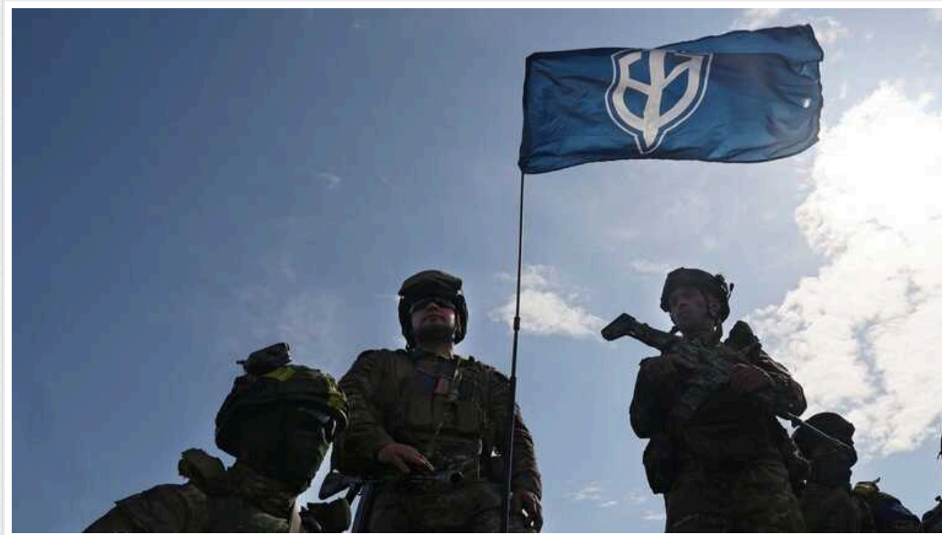
У ЗМІ розповіли як проходить рейд ЛСР та РДК і чи зможуть вони «взяти» Белгородщину та Курщину