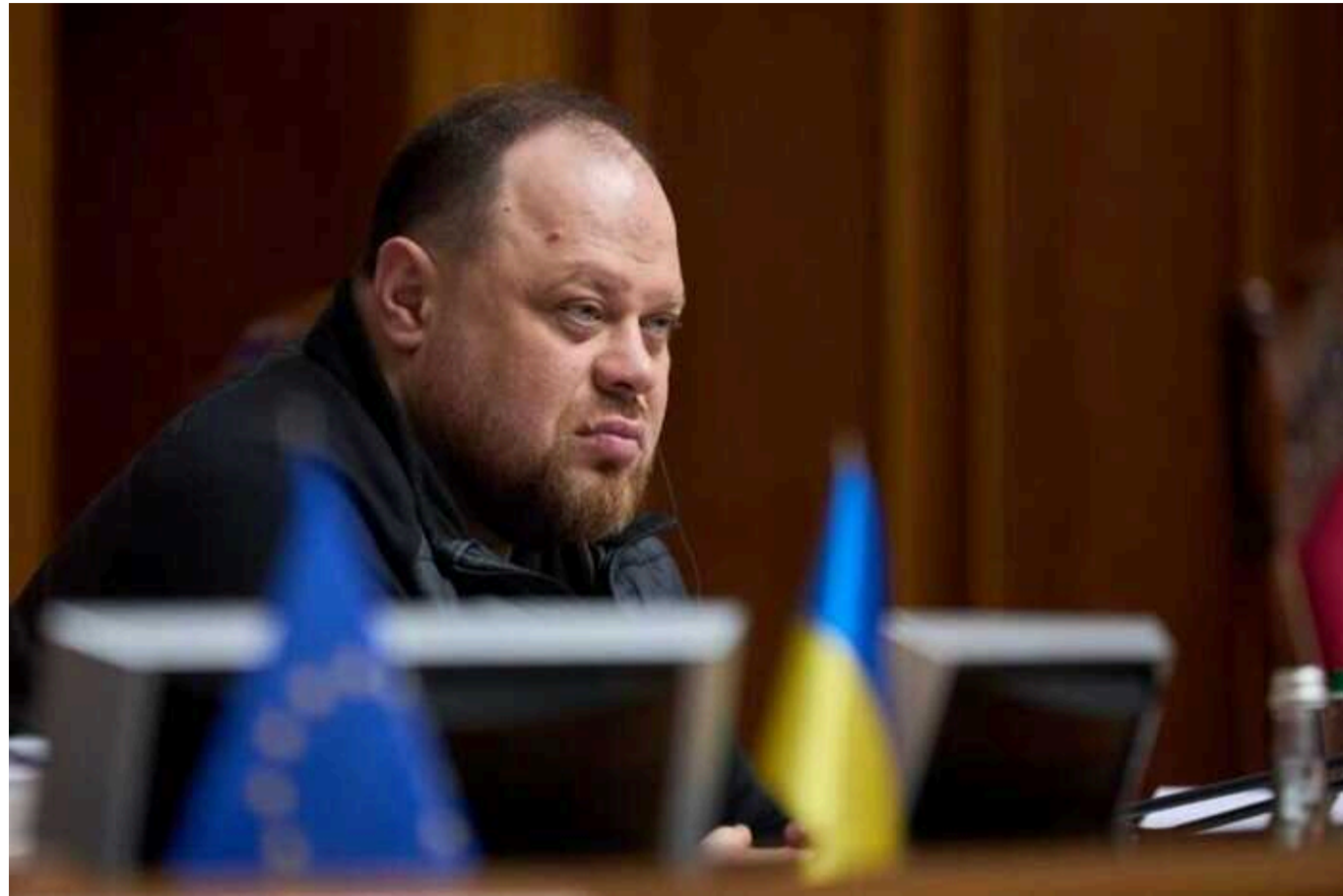
На одного захисника має бути вісім цивільних, які забезпечують економіку, — Стефанчук

За словами спікера парламенту, важливо з'ясувати, чи "доцільний цей механізм" бронювання для громадян, які заробляють від 35 тисяч.