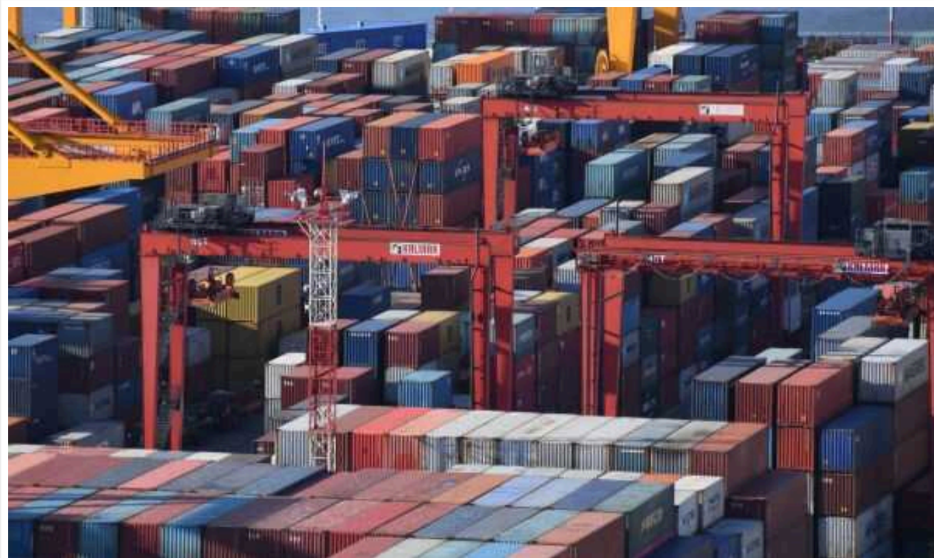
Україна відновлює перевезення контейнерів по Чорному морю