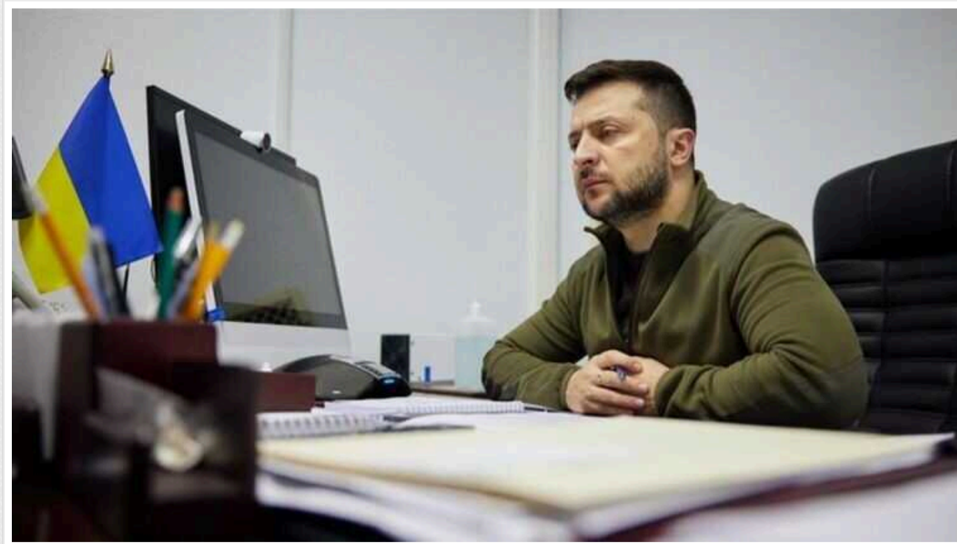
Платники податків тепер можуть взаємодіяти з податковою через відеозв'язок: Зеленський підписав закон

Президент Володимир Зеленський підписав законопроект №9662, який дає платникам податків можливість взаємодіяти з Державною податковою службою у режимі відеоконференції.