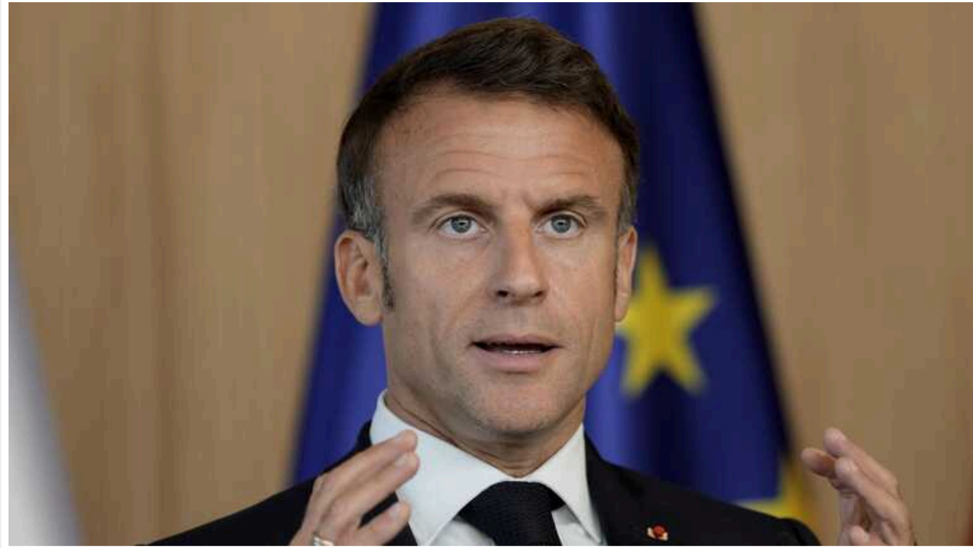
Франція ніколи не візьме на себе ініціативу у воєнних діях в Україні, - Макрон

Таку заяву зробив президент Франції Емманюель Макрон під час телеінтерв'ю.