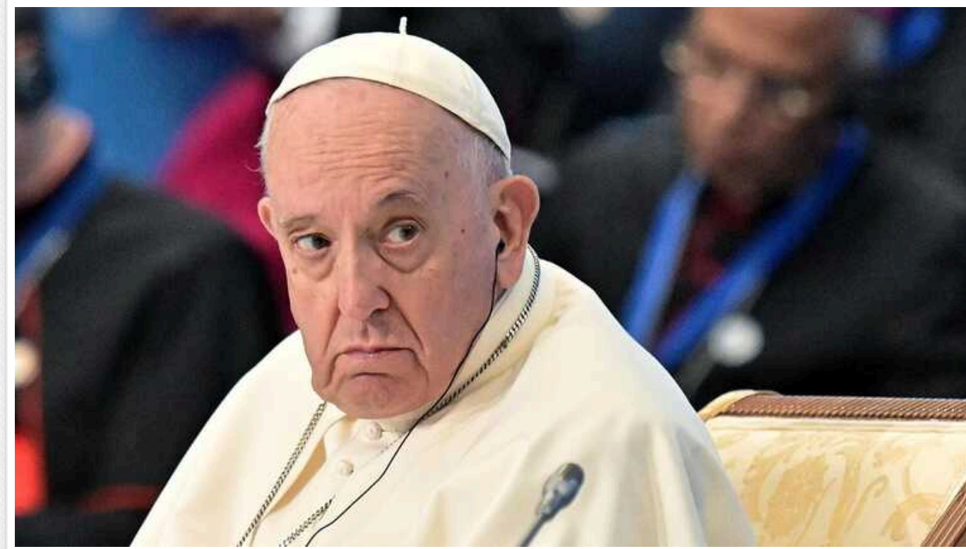
Франциск своєю ідеєю про необхідність України піти на переговори порушив тему, яку в Європі не наважуються обговорювати