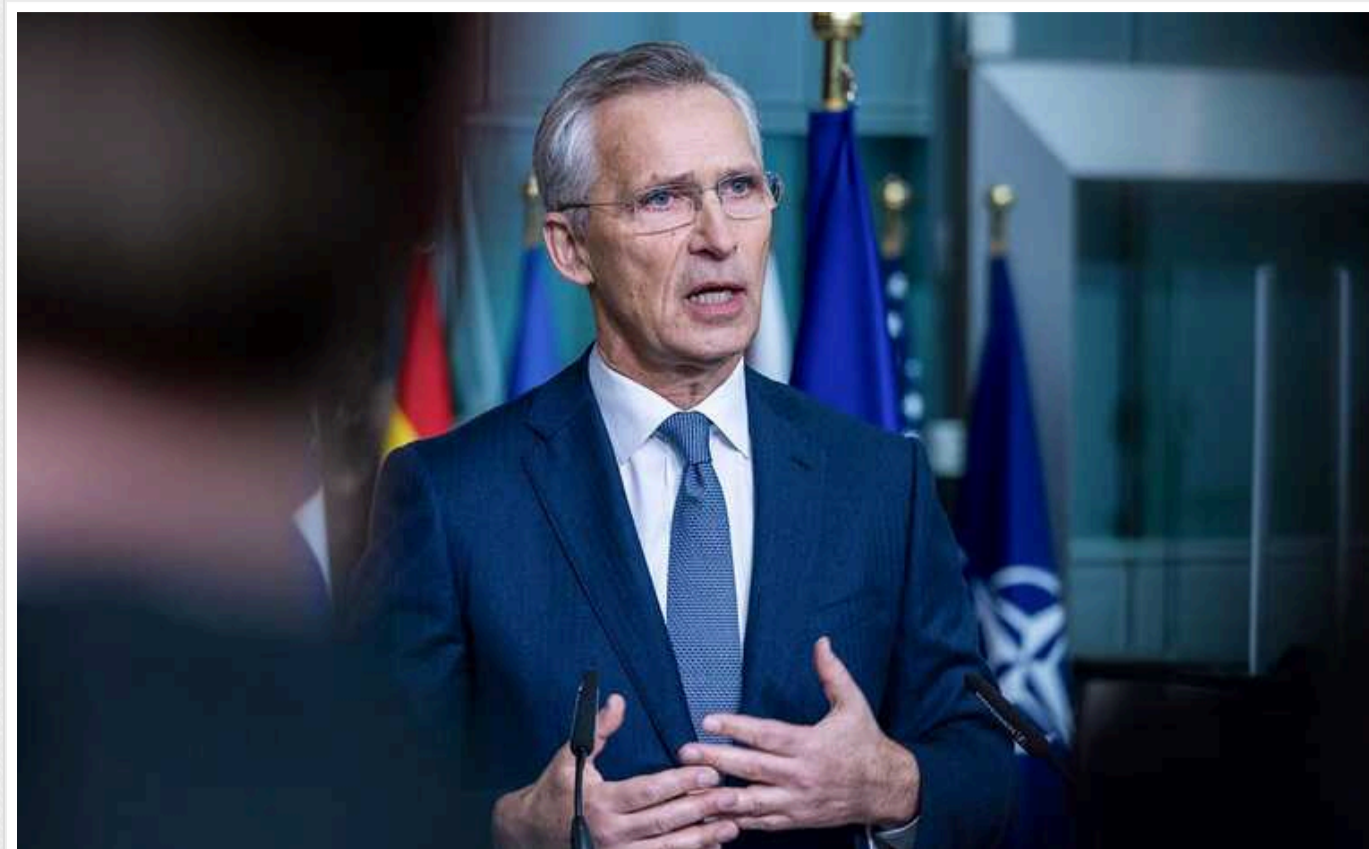
Столтенберг: Втрати РФ у війні проти України перевищили 350 тисяч

З початку повномасштабного вторгнення в Україну російські окупанти втратили 350 тисяч своїх солдатів убитими та пораненими.