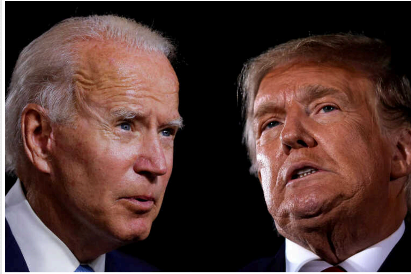
Байден випереджає Трампа в електоральних симпатіях американців, – опитування

Чинний президент США демократ Джо Байден випереджає колишнього голову Білого дому, кандидата на голову посаду країни, республіканця Дональда Трампа в електоральних симпатіях американських виборців.