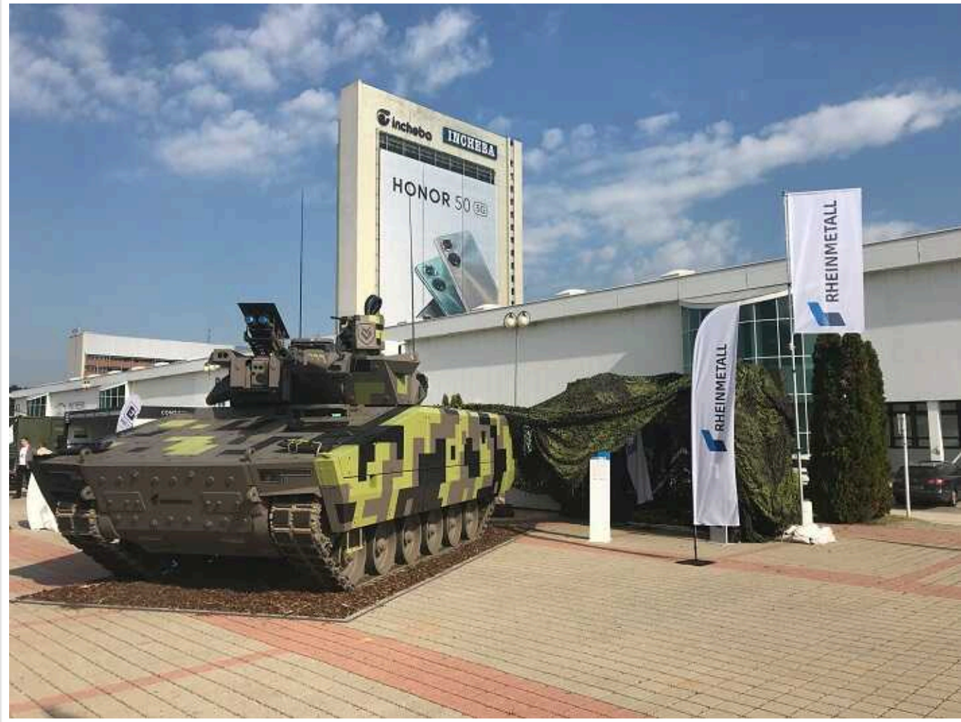
Rheinmetall заявив про плани відкрити в Україні не менше чотирьох заводів

Все це на тлі прогнозів рекордного прибутку від цьогорічних продажів озброєнь, пише AFP.