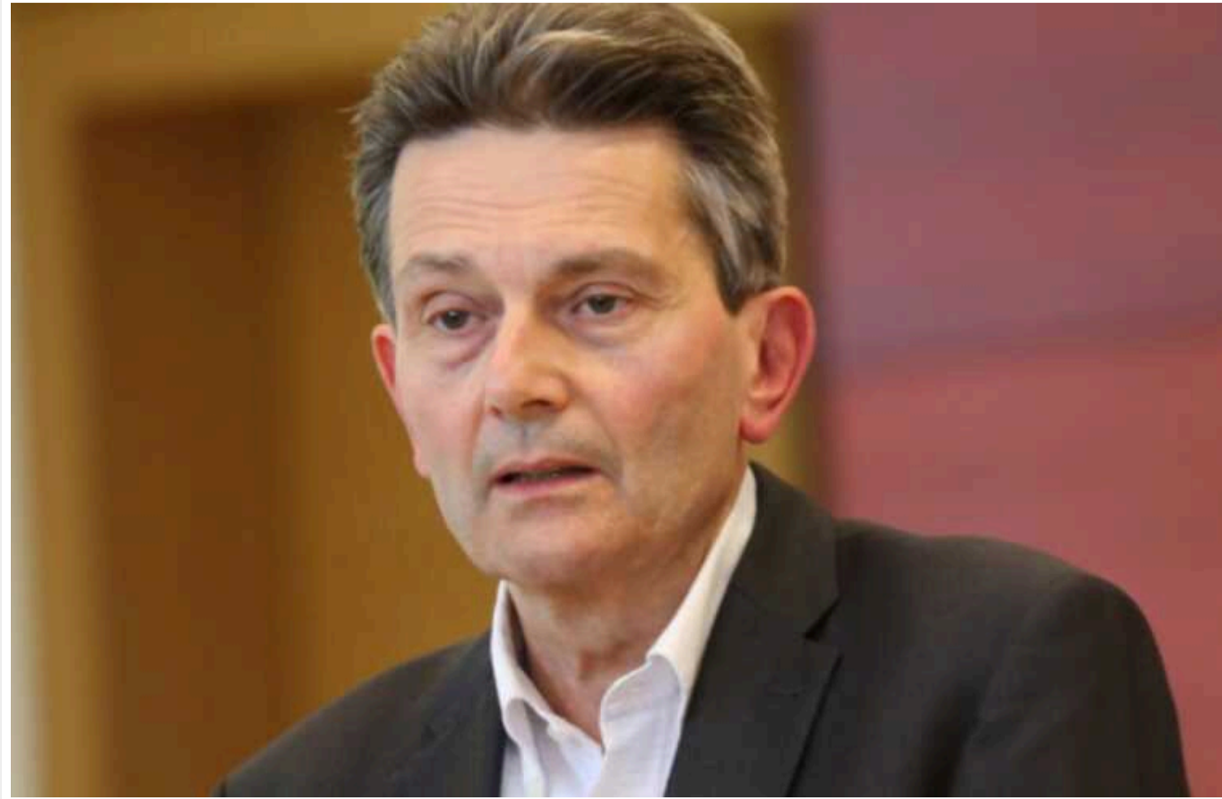
У Німеччині правляча партія закликала "заморозити" війну в Україні

Таку заяву зробив лідер німецької фракції СДПН у Бундестазі Рольф Мютценіх.