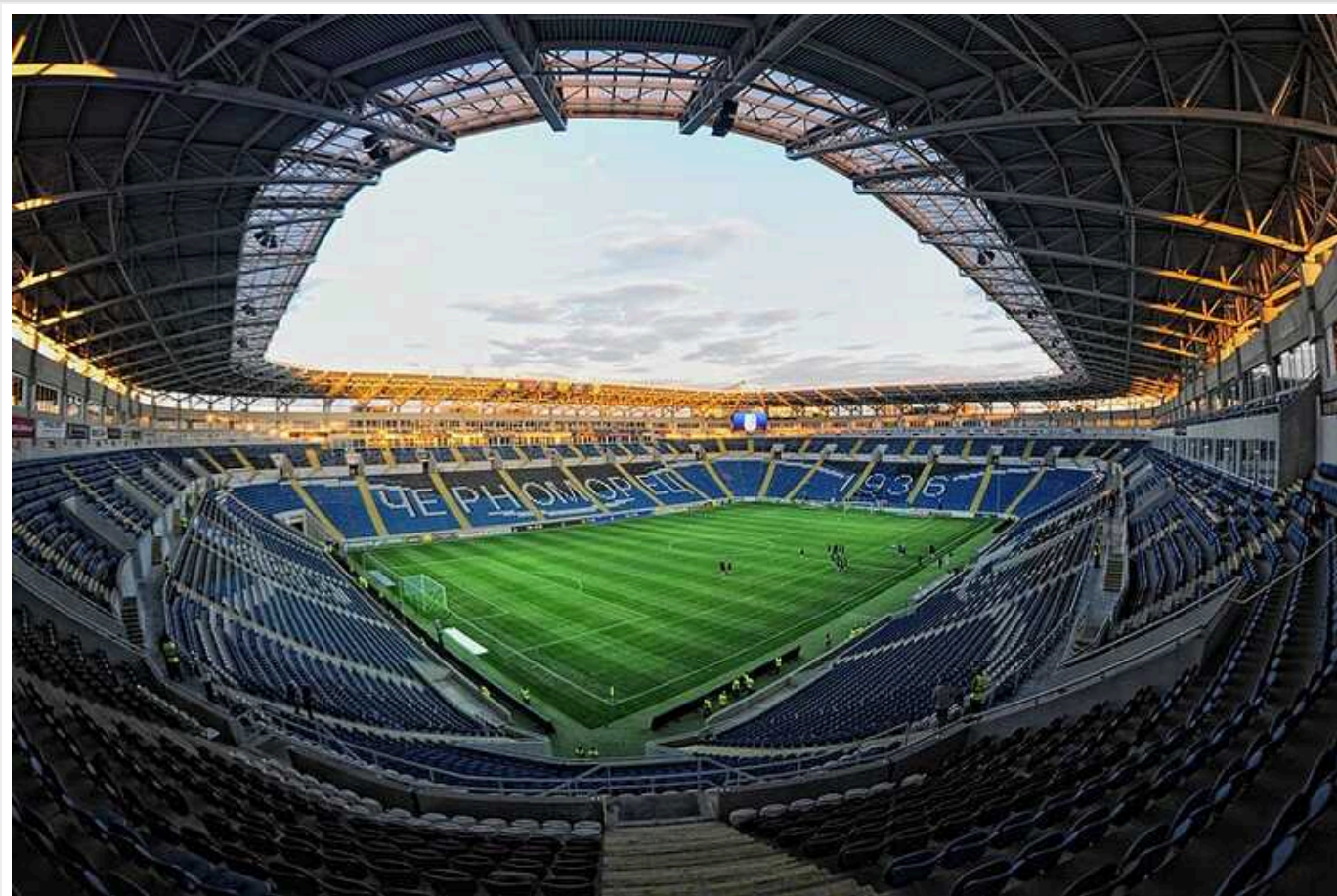
Одеська ОВА заборонила пускати глядачів на футбольний матч місцевого клубу "Чорноморець"

В Одесі спочатку дозволили пустити глядачів на футбольний матч місцевого клубу "Чорноморець", але після обурення в мережі обласна військова адміністрація (ОВА) скасувала своє рішення.