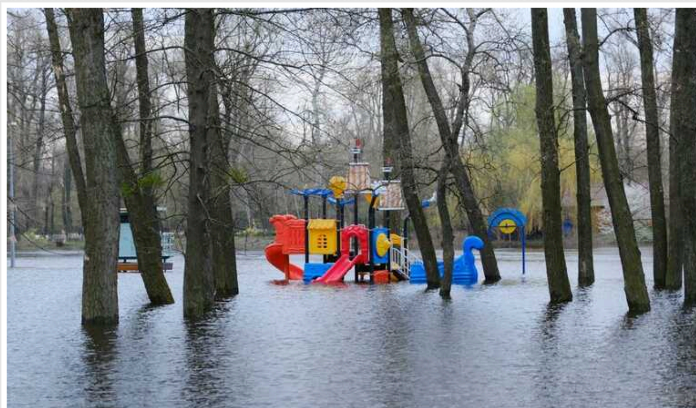
У Києві рівень води у Дніпрі піднявся майже на 45 см

Як повідомляє КГВА, повінь столиці загрози не несе, аварійні підтоплення містом не зафіксовані, а до критичного рівня води ще понад 1,3 м.