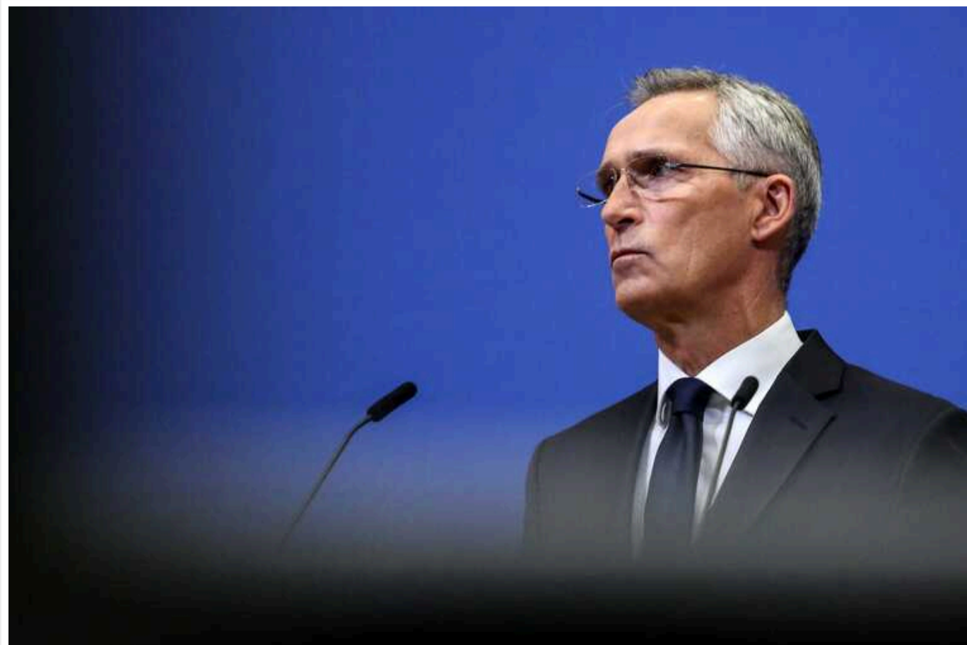
Столтенберг висловився про брак боєприпасів в Україні: проблема не у потужностях та грошах

За словами генсека НАТО, союзники Києва не забезпечують Україну достатньою кількістю снарядів, що має наслідки на полі бою.