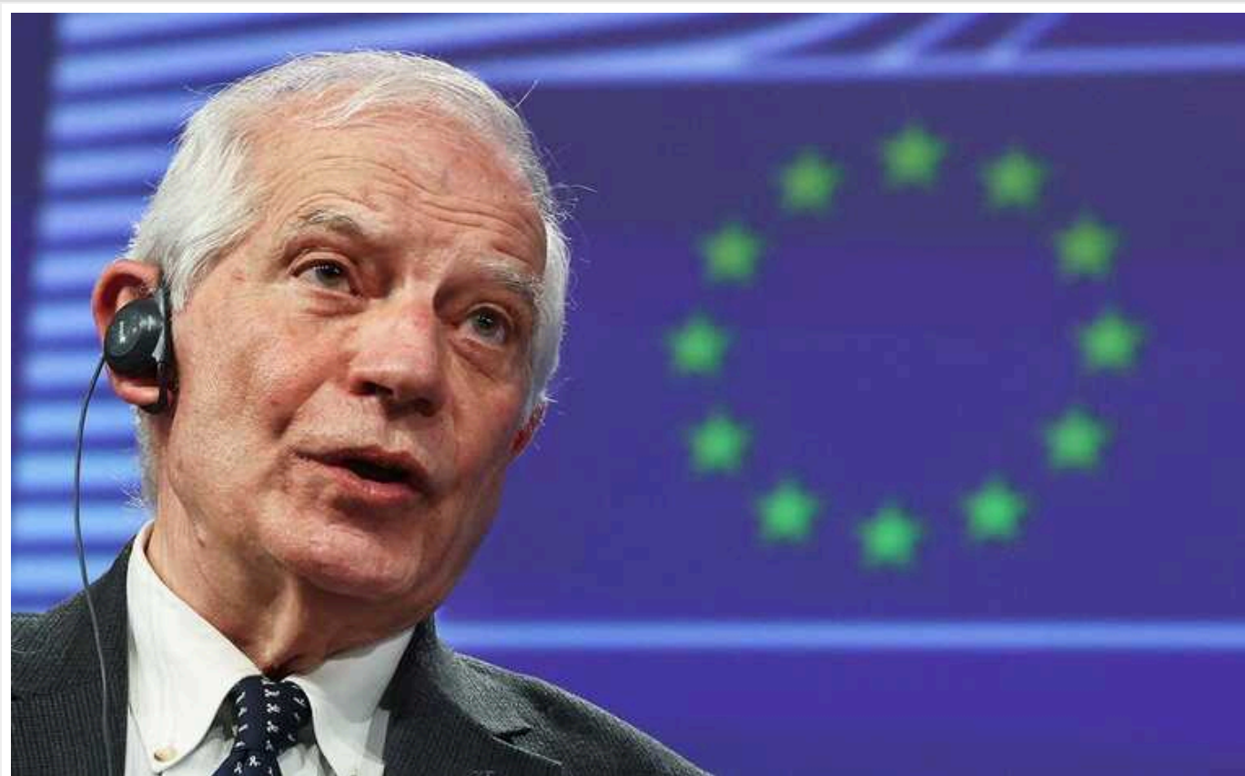
Борель: Папа Римський "увійшов до саду, до якого його ніхто не кликав" зі своїми заявами про необхідність для України здатися

Глава європейської дипломатії Жозеп Боррель заявив, що Папа Римський "увійшов до саду, до якого його ніхто не кликав" зі своїми заявами про необхідність для України здатися.