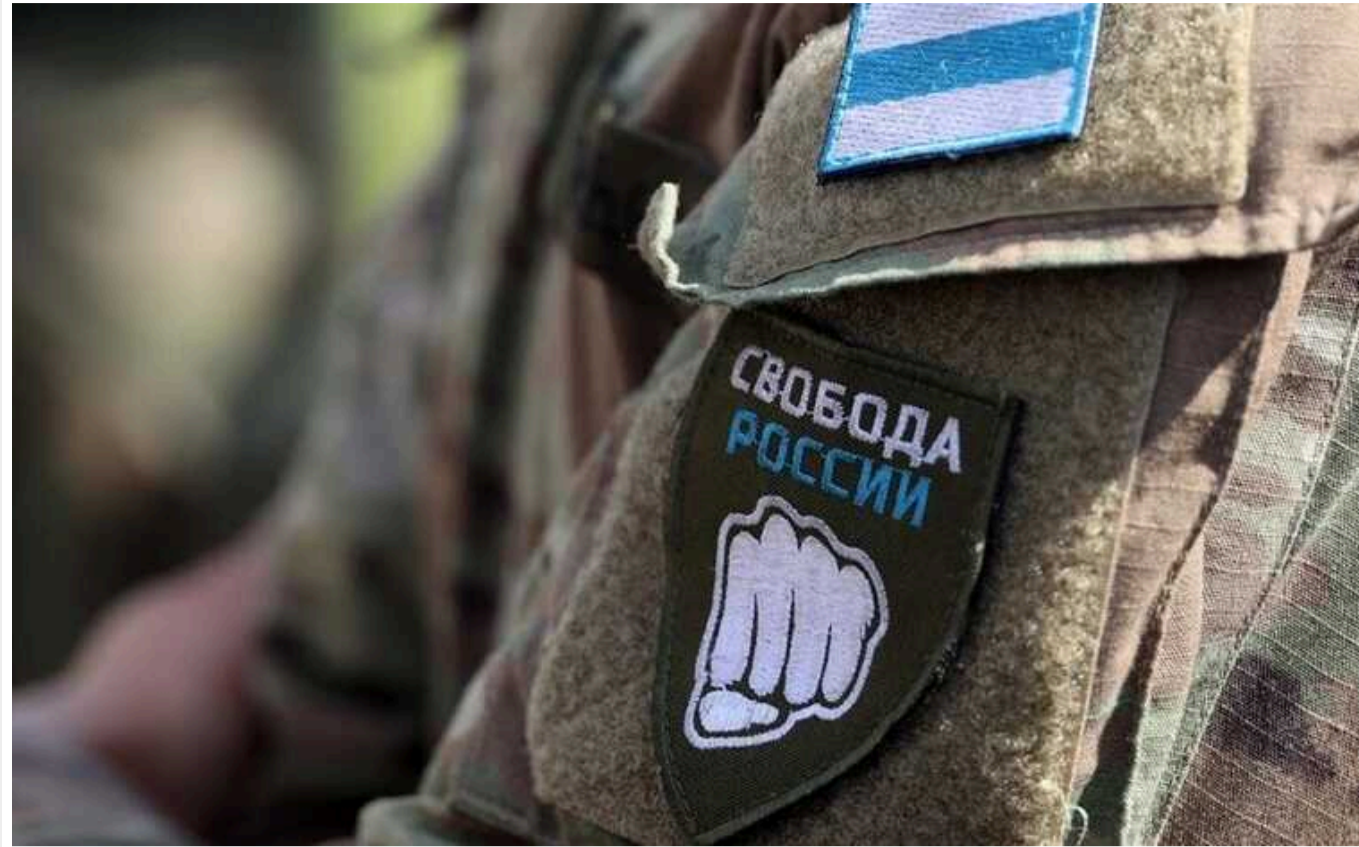
Легіон "Свобода Росії" заявив про знищення складів БК у Курській області

У Курській та Белгородській областях продовжуються бойові зіткнення між добровольчими формуваннями та регулярною армією РФ. Легіон "Свобода Росії" заявив про знищення складів БК у Курській області.