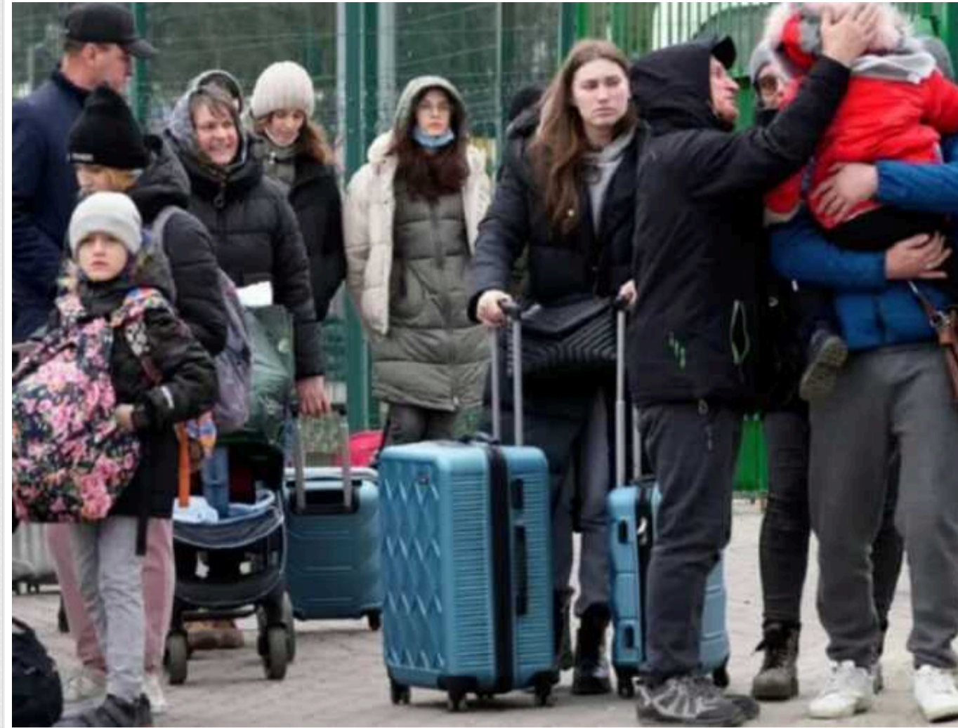
Частині українців, які виїхали за кордон, можуть скасувати виплати

В Україні іноді фіксують випадки припинення пенсійних виплат громадянам після їхнього виїзду за кордон. Існує ціла низка підстав, за яких можуть припинити надання коштів. Зокрема, у разі виїзду на постійне місце проживання за кордон, якщо інше не передбачено міжнародним договором України.