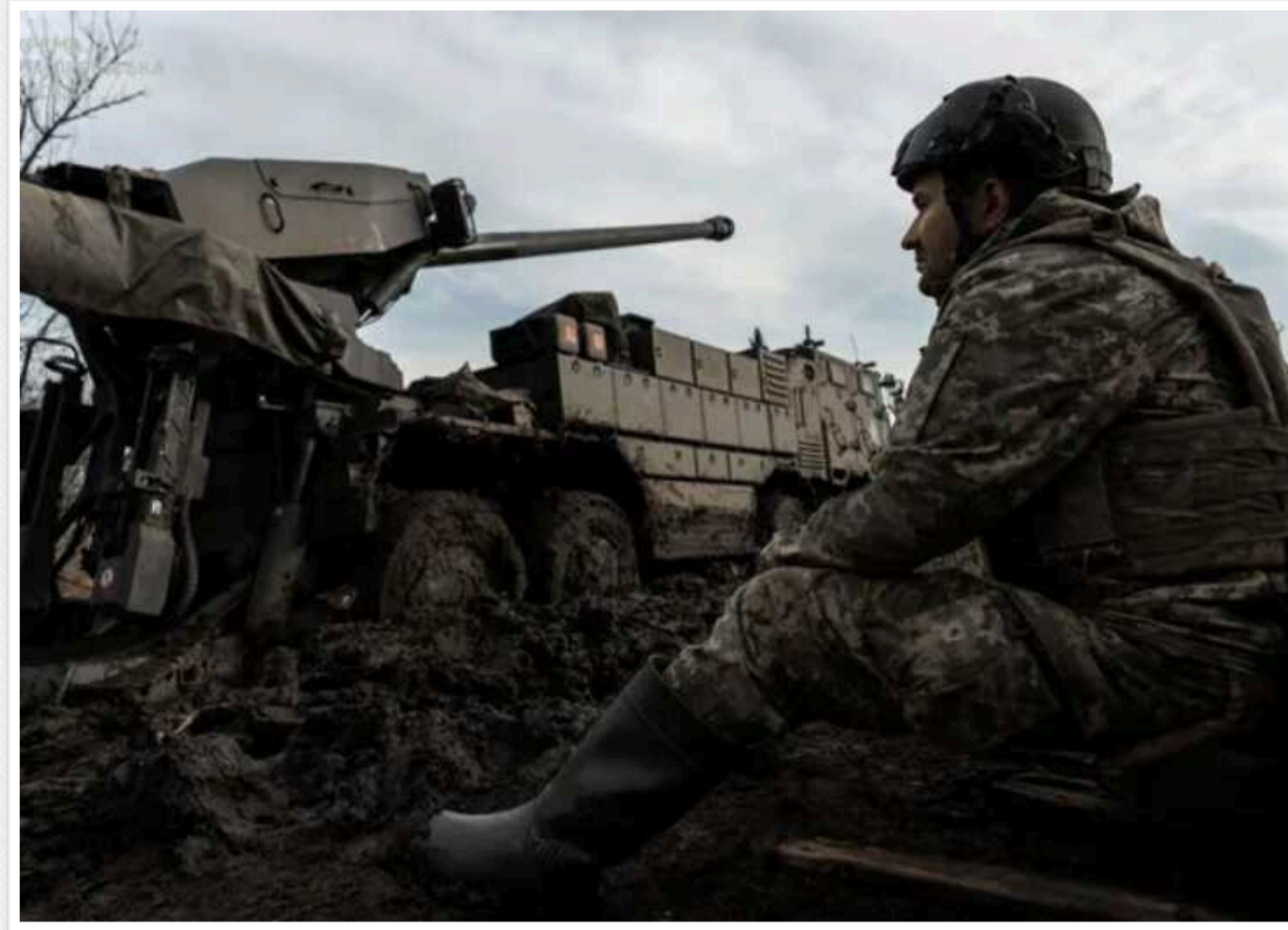
ISW: Затримка західної допомоги зробить лінію фронту в Україні "крихкою"

Нестача боєприпасів та іншої військової техніки в Україні, спричинена затримками в наданні військової допомоги США, вплине на оборонні та наступальні можливості ЗСУ. Вона може зробити нинішню українську лінію фронту "більш крихкою", ніж можна було б припустити щодо повільного наступу військ РФ у різних секторах.