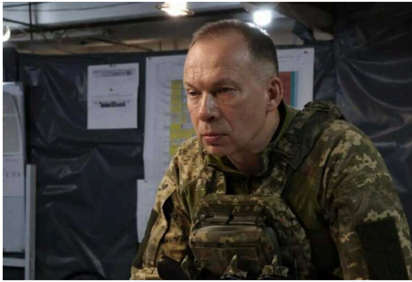
Сирський привітав українців з Днем українського добровольця

Головнокомандувач ЗСУ Олександр Сирський привітав українців з Днем добровольця.