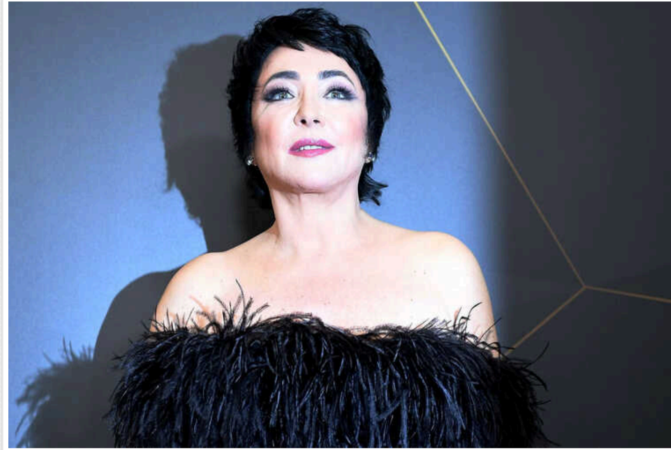
Лоліта після "голої вечірки" категорично відмовилася їхати на Донбас до окупантів

Уродженка Закарпаття та зрадниця України співачка Лоліта Мілявська заявила, що ні на крок не ступить на тимчасово окуповану Росією територію. Вона нібито не бажає відновити репутацію перед урядом та шанувальниками після славнозвісної "голої вечірки", як це активно робить колега – Філіп Кіркоров.