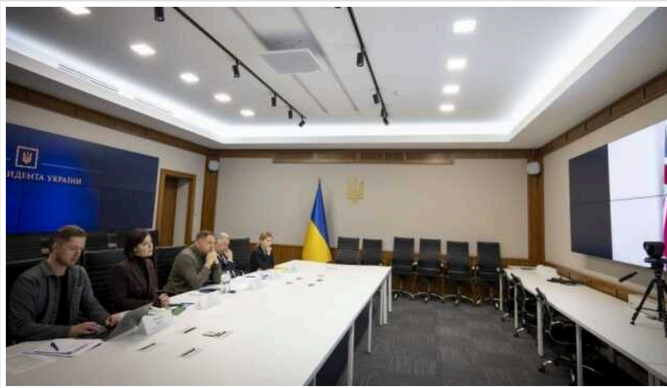
Єрмак і Расмуссен обговорили кроки для інтеграції України в євроатлантичну систему безпеки

Керівник Офісу Президента Андрій Єрмак і Генеральний секретар НАТО у 2009-2014 роках, експрем'єр-міністр Данії Андерс Фог Расмуссен обговорили кроки, необхідні для інтеграції України в євроатлантичну систему безпеки.