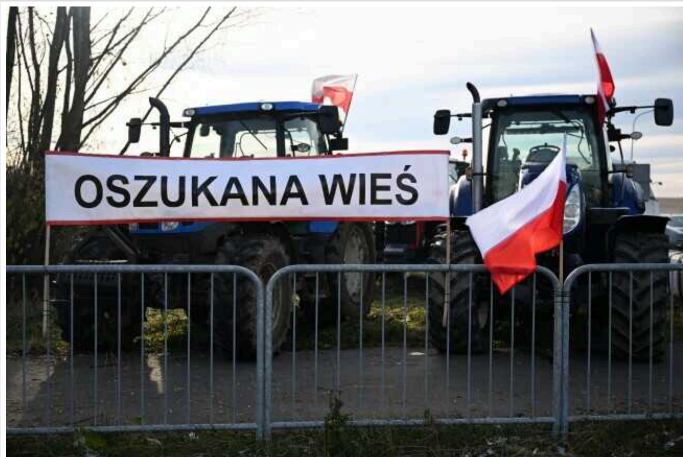
Через блокаду польських фермерів є черги і на кордоні ще з трьома країнами Євросоюзу

Польські фермери продовжують блокувати рух українського вантажного транспорту в напрямку 5 пунктів пропуску, через це спостерігаються черги вантажівок і на кордоні зі Словаччиною, Угорщиною та Румунією.