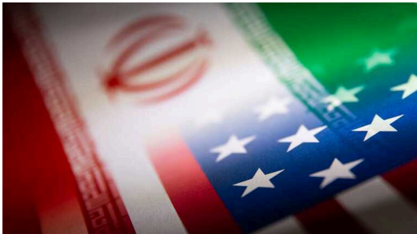
Financial Times: Сполучені Штати провели секретні переговори з Іраном щодо нападів хуситів у Червоному морі

США провели секретні переговори з Іраном цього року, намагаючись переконати Тегеран використати свій вплив на еменський рух хуситів. Зокрема, щоб припинити напади на кораблі в Червоному морі.