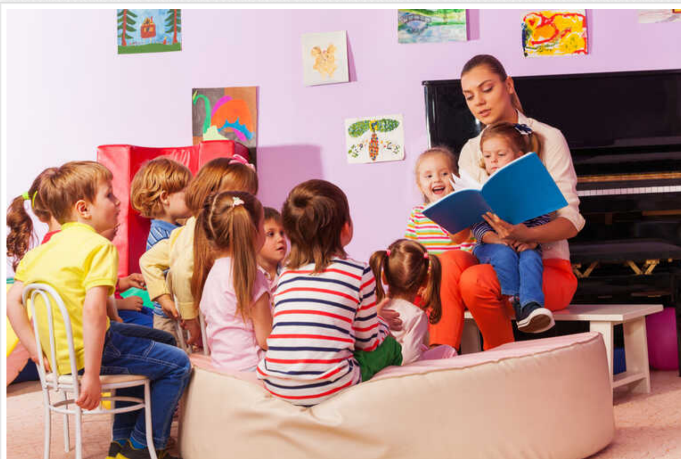
В Україні хочуть відкрити дитячі садки при офісах

В Україні хочуть відкрити дитячі садки при офісах, що призведе до привабливості бізнесу для співробітників. На думку заступниці міністра освіти Євгенії Смірної, нині мамам буде спокійніше, якщо їхні діти перебуватимуть у тій самій будівлі, що й вони.