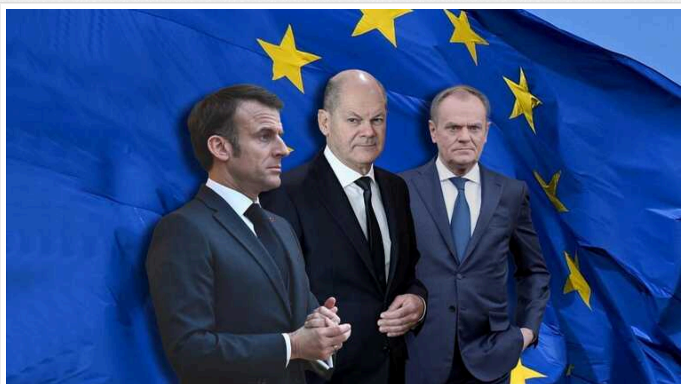
Туск та Макрон їдуть «заспокоїти» Шольца: говоритимуть про підтримку України

На тлі значних німецько-французьких розбіжностей щодо підходів до підтримки України у війні проти Росії Олаф Шольц зустрінеться з Емманюелем Макроном і Дональдом Туском у Берліні.