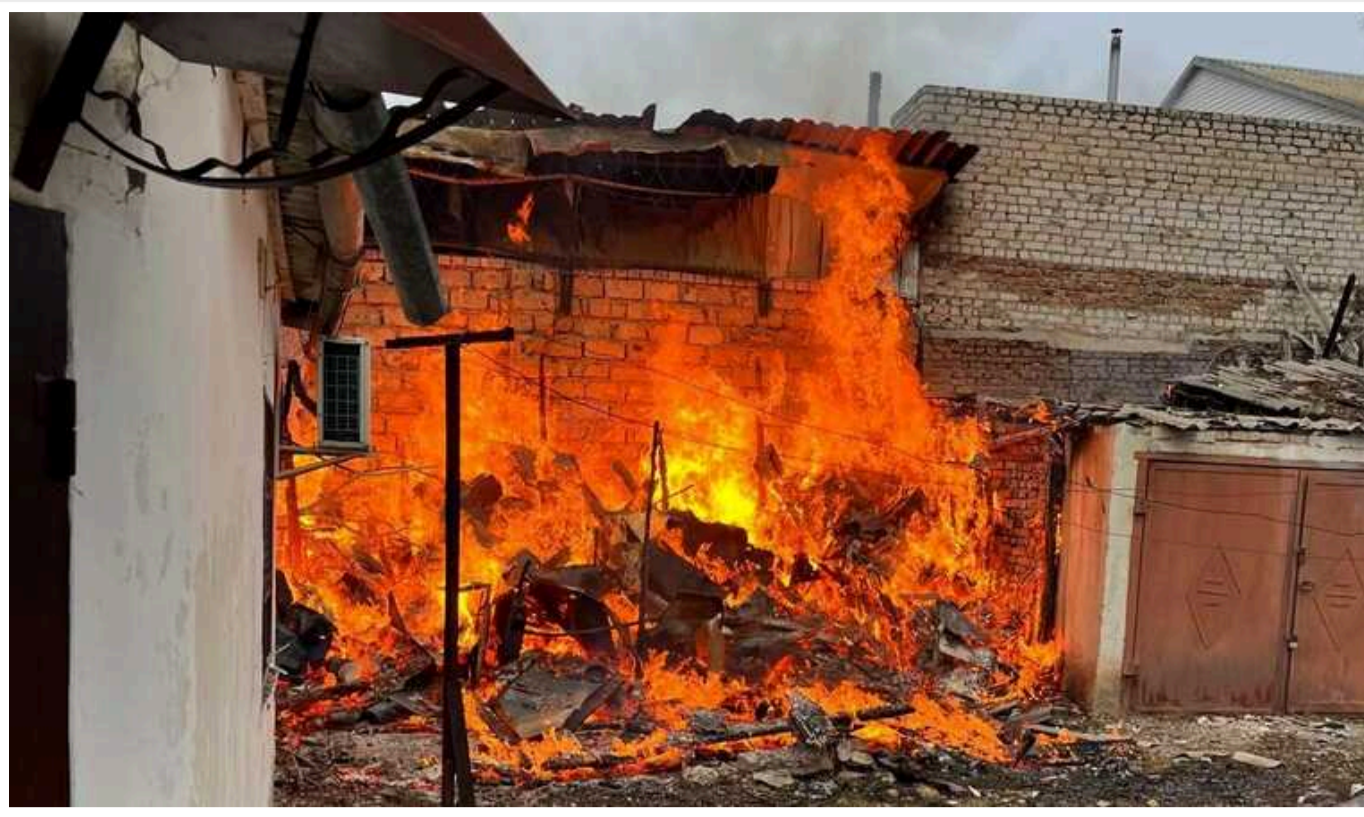
Окупанти обстріляли припортову інфраструктуру Херсона

Загарбники обстріляли 9 населених пунктів Херсонської області.