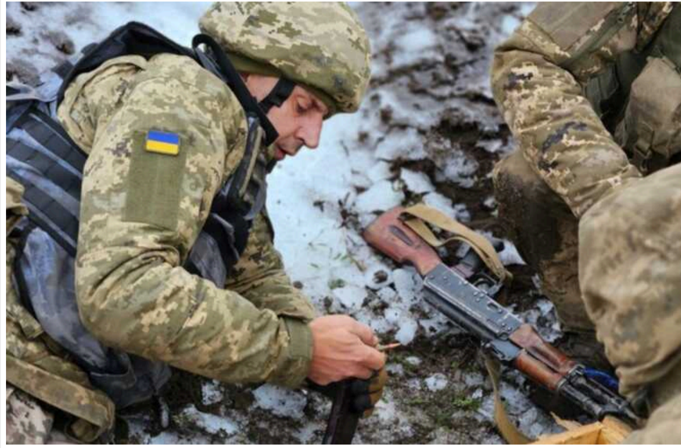
Ситуація на фронті: на Авдіївському напрямку ЗСУ відбили 20 атак ворога

В Україні на фронті впродовж доби відбулося 79 бойових зіткнень. Ворог атакує на трьох напрямках у Донецькій області.