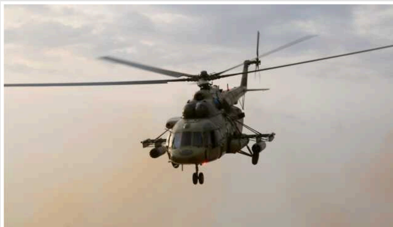
У РФ впав гелікоптер із 20 людьми на борту: є загиблі

У Магаданській області Росії розбився гелікоптер Мі-8 із 20 людьми на борту, щонайменше 2 людини – за іншими даними 1 – загинули.