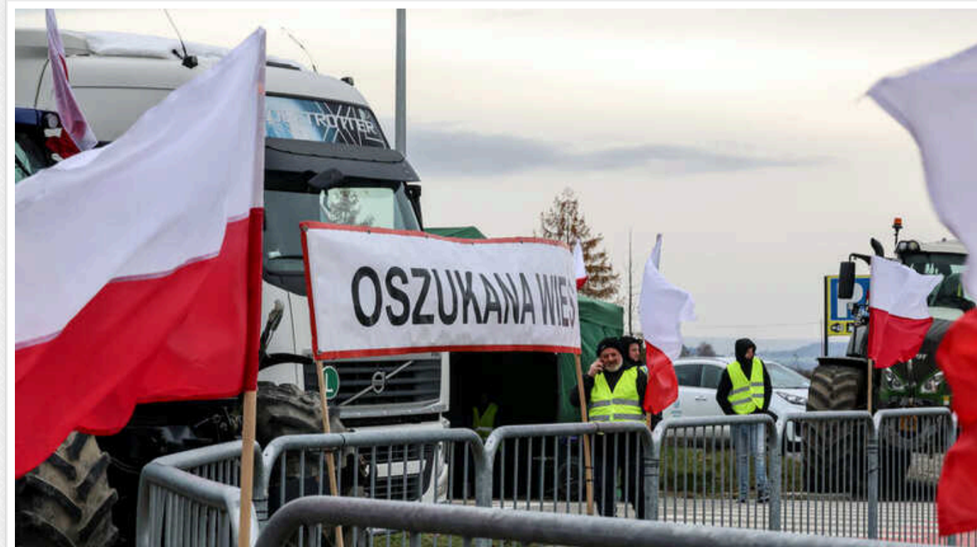
У Польщі фермери вимагають від Брюсселя 15 млрд євро компенсацій з воєнного фонду

Польські фермери оцінюють свої збитки у близько 70 мільярдів злотих і вимагають виплати з воєнного фонду Європейського Союзу. Зокрема, профспілка вимагає від прем'єр-міністра Польщі Дональда Туска та міністра сільського господарства Чеслава Секерського розпочати процес отримання цих коштів від Брюсселя.