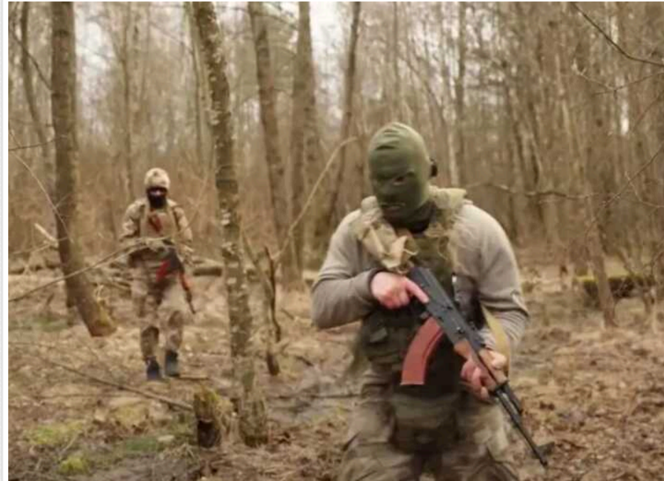
Колумбійці з Інтернаціонального легіону розказали, що їх мотивує воювати за тисячі кілометрів від дому

У лавах Інтернаціонального легіону ЗСУ воюють представники багатьох країн світу. Серед них є і колумбійці.