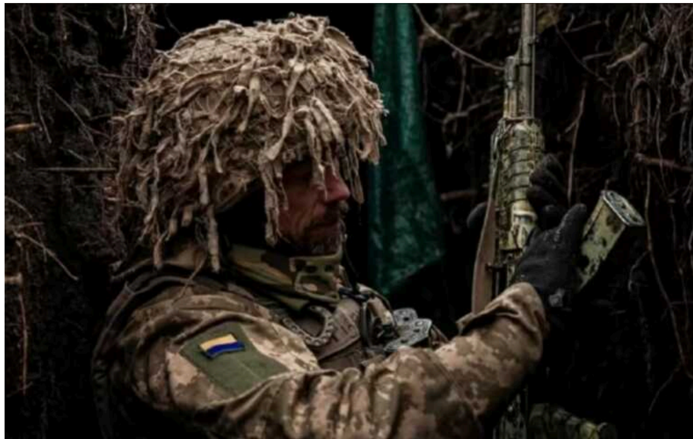
ISW попередив про небезпеку швидкого прориву військами РФ

Дефіцит боеприпасів та військового обладнання, який спричинили затримки допомоги з США, може зробити нинішню лінію фронту дуже вразливою. Цим можуть скористатися російські війська для раптового прориву.