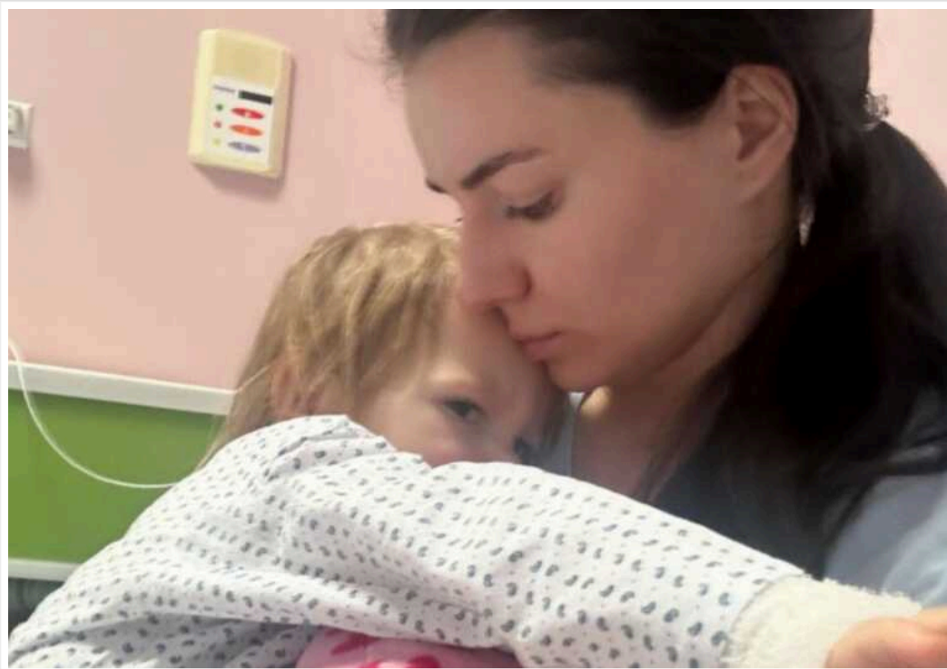
У дитячому садку Вроцлава 2-річна дівчинка з України отримала опік 2-го ступеня

Все сталося ще 9 лютого, але тільки зараз батьки вирішили оприлюднити.