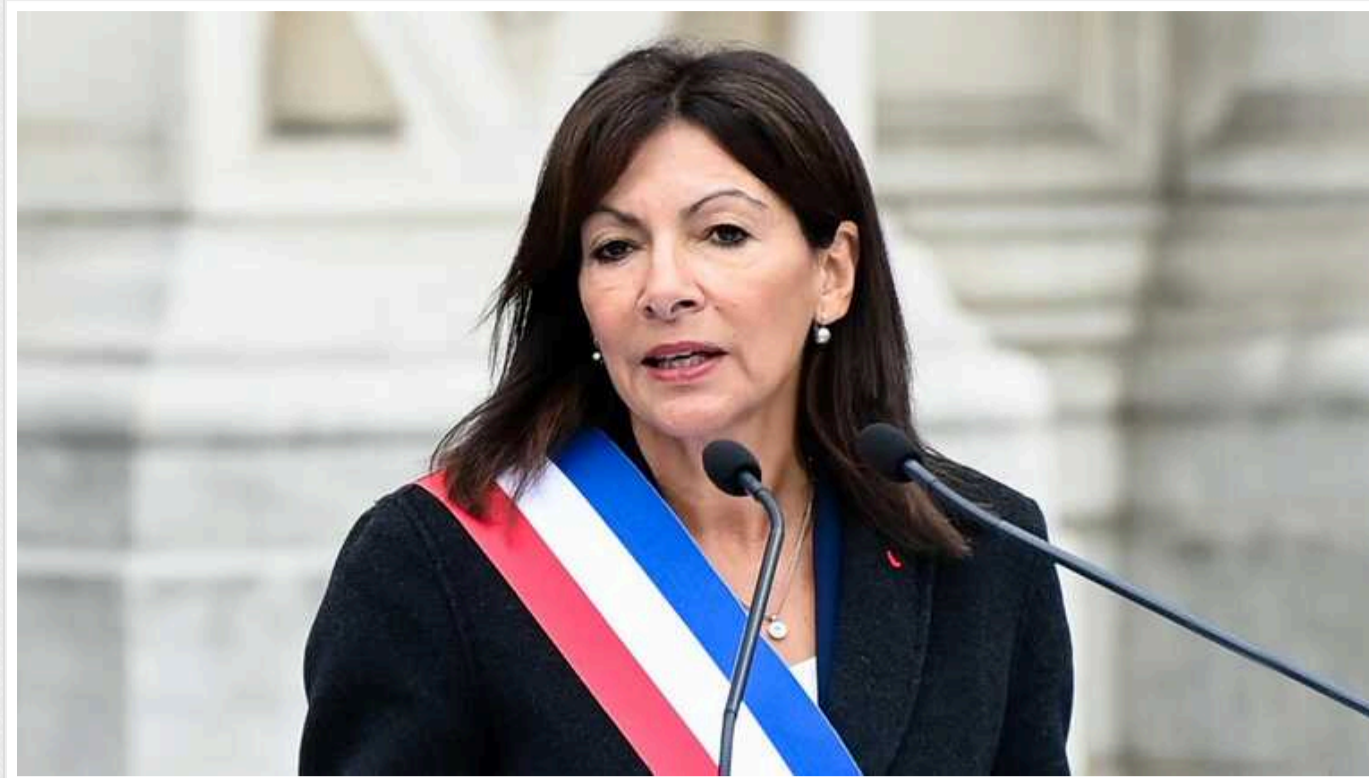
Мер Парижа проти участі росіян на ОІ-2024: не можна вдавати, що війни в Україні немає

Мер Парижа Анна Ідальго не хоче допускати росіян та білорусів до участі в Олімпіаді, яка пройде у столиці Франції у цьому році.