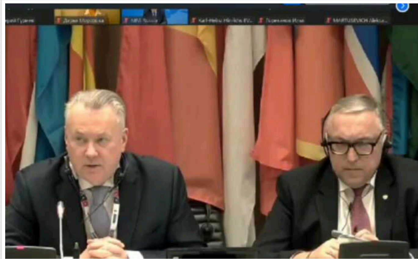
Маріуполець у прямому ефірі збентежив російських посадовців заявами про вбивства цивільних

Житель Маріуполя заявив, що окупація міста – для нього особиста трагедія, і всі знають, хто насправді війнний злочинець.