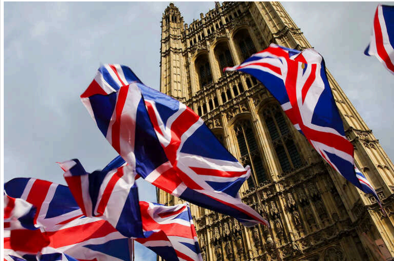
Bloomberg: Через загрозу шпигунства Велика Британія хоче посилити обмеження проти громадян КНР

Уряд Великої Британії розглядає можливість скорочення числа громадян Китаю, які можуть в'їжджати в країну в офіційних справах. Це пов'язано зі шпигунською загрозою з боку Пекіна.