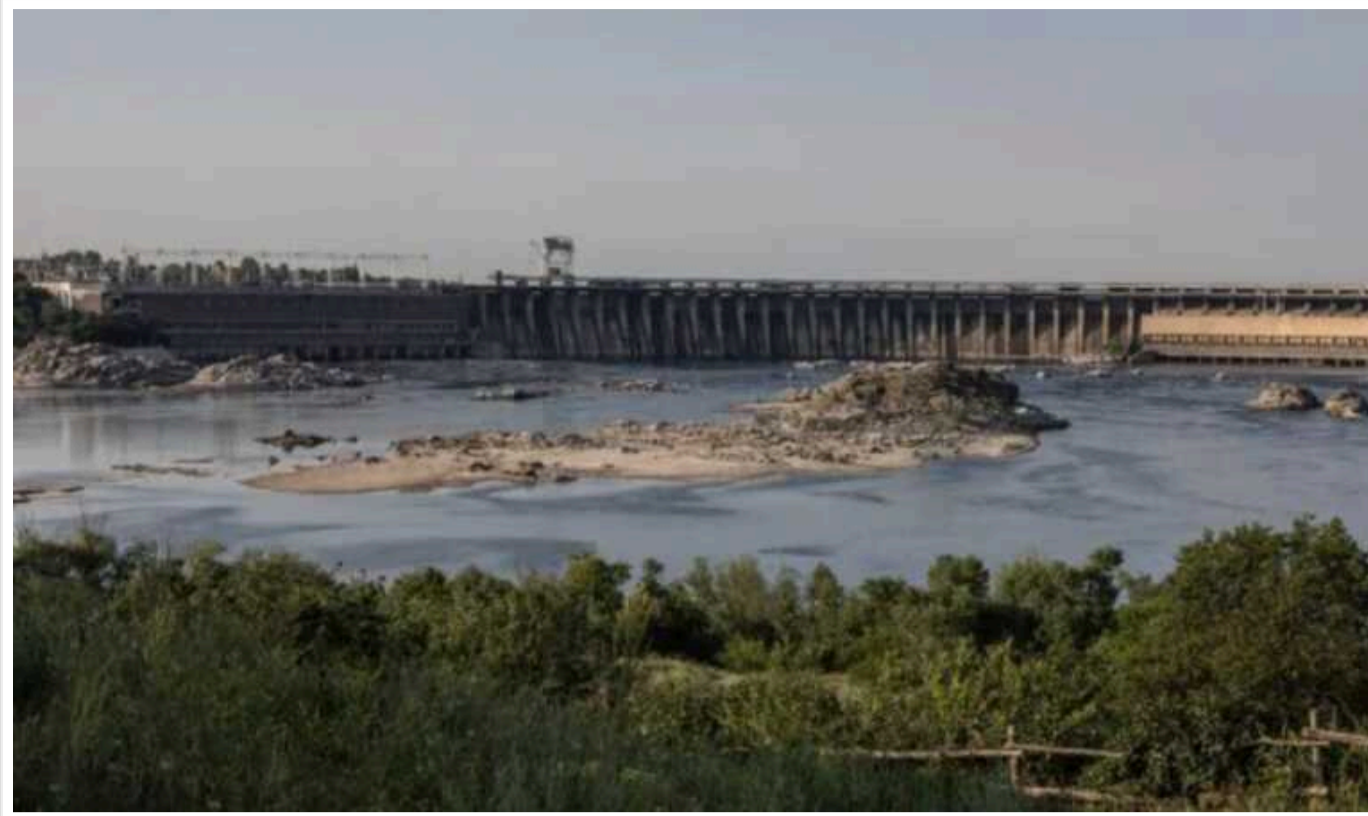
До Каховського водосховища почала повертатися вода

За інформацією журналістів, пояснити прибуття води можна весняним таненням снігів, яке принесло додаткову вологу в пониззя Дніпра.