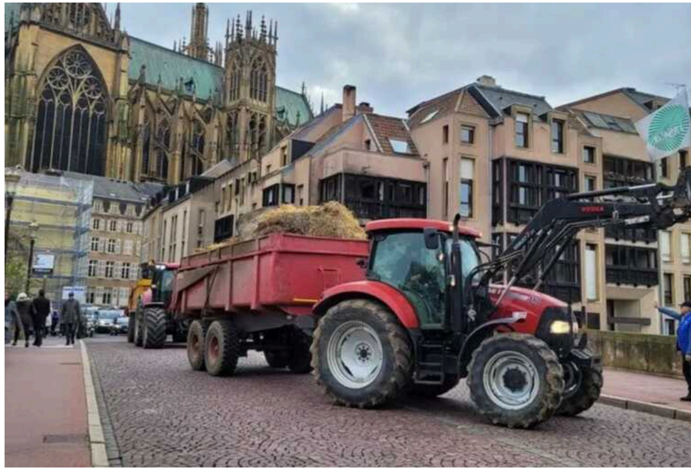
Французькі фермери напали на будинок сенатора Франсуа Патріата: повісили на його ворота трупи кабанів

Протестуючі фермери розгромили будинок французького сенатора Франсуа Патріата, викинувши гній, шкури тварин і два трупи диких кабанів біля входу до резиденції Кот-д'Ор.